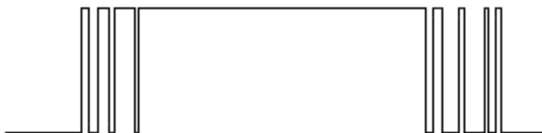
Figuur 5.1: Mogelijk signaal van een denderende knop.

Dit hoofdstuk legt verschillende software technieken uit om knoppen te ontdenderen. Het woord ontdenderen suggereert dat er iets aan het denderen is en daarmee moet stoppen. Dit denderen (Engels: bouncing) wordt veroorzaakt door de veertjes binnen knoppen. Wanneer een mechanische knop wordt ingedrukt of losgelaten zal de veer het contact laten denderen en hiermee een aantal keren een elektrische connectie maken. Hierdoor zou een enkele druk kunnen worden gezien (door de \mu\text{C} ) als het meerdere keren, snel achter elkaar, indrukken van de knop.